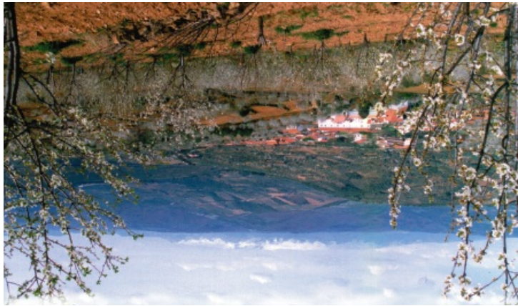
CEREZOS EN SOTOSERRANO

Este sendero conocido en Europa como E-7, atraviesa el Parque Natural de Las Batuecas-Sierra de Francia de este a oeste a lo largo de 48,5 km. Incluye dos pequeñas variantes. Si bien se puede hacer todo el recorrido completo por la provincia de Salamanca desde el municipio de La Hoya hasta el de Aldea del Obispo, para los más atrevidos que se quieran aventurar a hacerlo completo, tendrán que atravesar la Península Ibérica desde Playa de Mar (Valencia) hasta Lisboa (Portugal) tras recorrer unos 1.200 km.