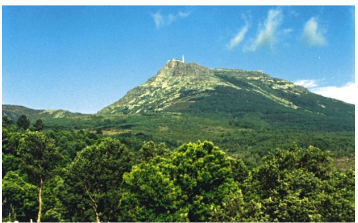
PEÑA DE FRANCIA

APUNTES: Sotoserrano: levantado sobre asentamiento prerromano, interesantes su iglesia de Nª Sª de la Asunción y la Torre del Reloj. Cepeda: antiguo castro prerromano, interesante la iglesia de San Bartolomé y la ermita en ruinas de San Marcos. Miranda: Declarada Conjunto Histórico en 1973, interesante su Castillo y su muralla con sus cuatro puertas, entre otras edificaciones. Mogarráz: Declarada también Conjunto Histórico recientemente, interesante su museo etnográfico y su iglesia. Monforte: interesante la iglesia de San Miguel y su imponente torre de granito. La Alberca: es el primer pueblo de España que fue declarado Conjunto Histórico en 1940, interesante el aula arqueológica, la iglesia de Nª Sª de la Asunción, antigua cárcel (ayuntamiento), entre otros. Peña de Francia: Reloj de Sol, el Convento. Monsagro: Ruta de los fósiles, Jardín Botánico, Las eras romanas.