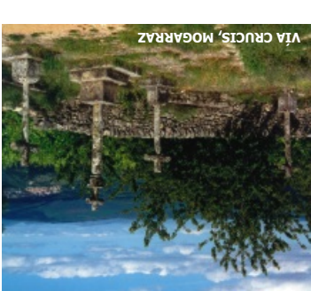
VIA CRUCIS, MOGARRAZ

donde pasaremos junto a un colmenar tradicional. Llegando al pueblo encontramos algunas acequias de regadío, así como las eras tradicionales y las construcciones del municipio decoradas con fósiles. El sendero continúa pasado el pueblo, vuelve a cruzar el río Agadón y discurre hasta el área recreativa de “El Vao” entre monte de carrascos, a partir de aquí seguimos por la pista forestal que nos lleva hasta el límite del Parque.