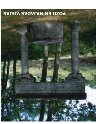
POZO EN MAJADAS VIEJAS

donde pasaremos junto a un colmenar tradicional. Llegando al pueblo encontramos algunas acequias de regadío, así como las eras tradicionales y las construcciones del municipio decoradas con fósiles. El sendero continúa pasado el pueblo, vuelve a cruzar el río Agadón y discurre hasta el área recreativa de “El Vao” entre monte de carrascos, a partir de aquí seguimos por la pista forestal que nos lleva hasta el límite del Parque.