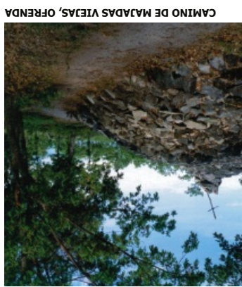
CAMINO DE MAJADAS VIEJAS, OFRENDA

Continúa el camino entre fincas de cultivos, algunas ya abandonadas, hasta llegar a un robledal que nos conduce hasta la carretera C-512 y al Área Recreativa de “La Regajera”. Desde aquí es aconsejable tomar la variante de 700 metros que nos lleva a Miranda del Castañar, hermosa Villa Medieval que no se puede dejar de visitar. De vuelta a La Regajera continúa el camino paralelo a la carretera de Mogarráz hasta alcanzar una pista de tierra que sale a nuestra izquierda y nos lleva entre diversas fincas hasta alcanzar un bosque de robles, castaños, madroños y durillos, con un aspecto casi selvático que nos conduce, tras una fuerte bajada, hasta el puente de piedra de los Tres Ojos, que cruza el río Milanos, lugar de los de mayor encanto del recorrido; subiremos paulatinamente el sendero empedrado hasta Mogarráz, donde a la salida del municipio en dirección Monforte de la Sierra observaremos la típica forma de cultivo en terrazas de la sierra, predominando olivo, vid y cerezo.